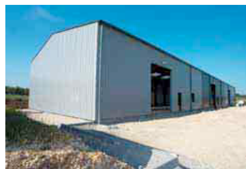
Les bâtiments-relais sont disponibles pour des entreprises cherchant à s'agrandir ou à s'implanter