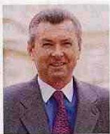
Henri de Raincourt

Sénateur de l'Yonne, Président du Conseil Général