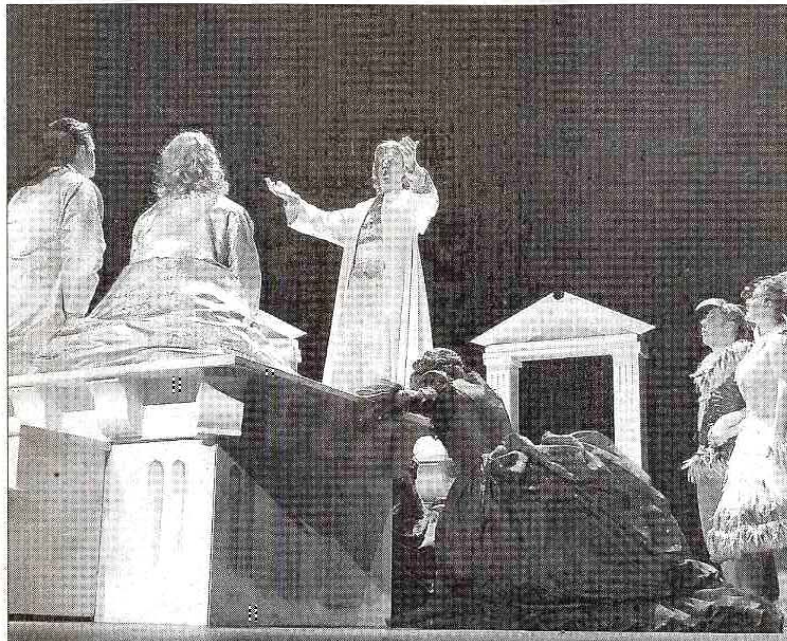
Sarastro réunit Tamino et Pamina, prouvant que « la force qui triomphe couronne en récompense la sagesse et la beauté pour l'éternité ».